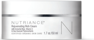
kod 369 | 50 ml