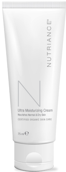
Kod 365 | 75 ml

Korak 3: Aktivira & Hrani – Vlaženje kože drugi je od tri koraka njege kože I preporuča se učiniti to nakon seruma. Održavanje kože vlažnom pomaže u zaštiti kože od dehidracije kao i zaštiti od potencijalno opasnih učinaka iz okruženja.